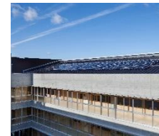
太陽光発電パネル (翔南中学校)