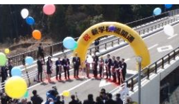
新学校橋開通 (H27. 3. 15)