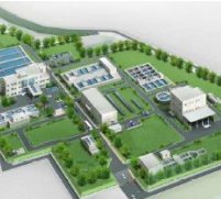
男川浄水場 整備イメージ