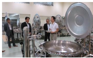
東部学校給食センター