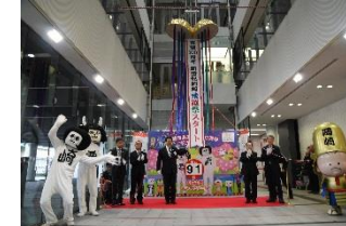
市制施行100周年記念事業 オープニングセレモニー (H28. 4. 1)