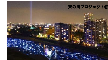
泰平の折り (H27. 12. 26)