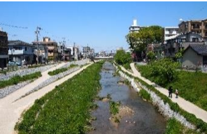
床上浸水対策特別緊急事業 (伊賀川)