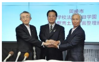
大学病院の建設に関する協定締結 (H26. 5. 29)