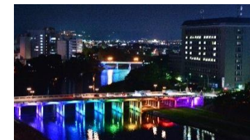
殿橋・明代橋のライトアップ 100周年記念の特別演出 (H28. 7. 1)