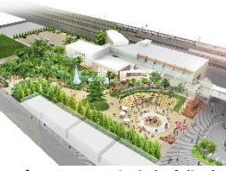
シビックコア地域交流拠点整備イメージ