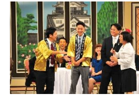
よしもと新喜劇での岡崎PR (H27. 8. 27)