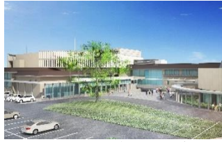
市民会館改修イメージ