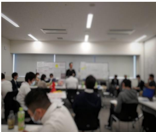
③ ブリーフィング風景